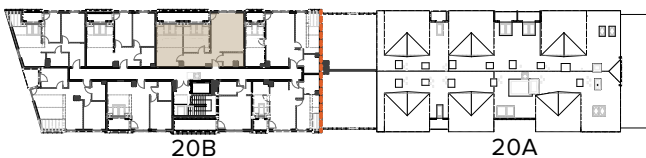
schemat lokalu na rzucie kondygnacji