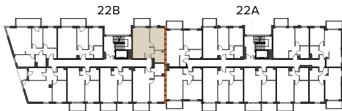
schemat lokalu na rzucie kondygnacji